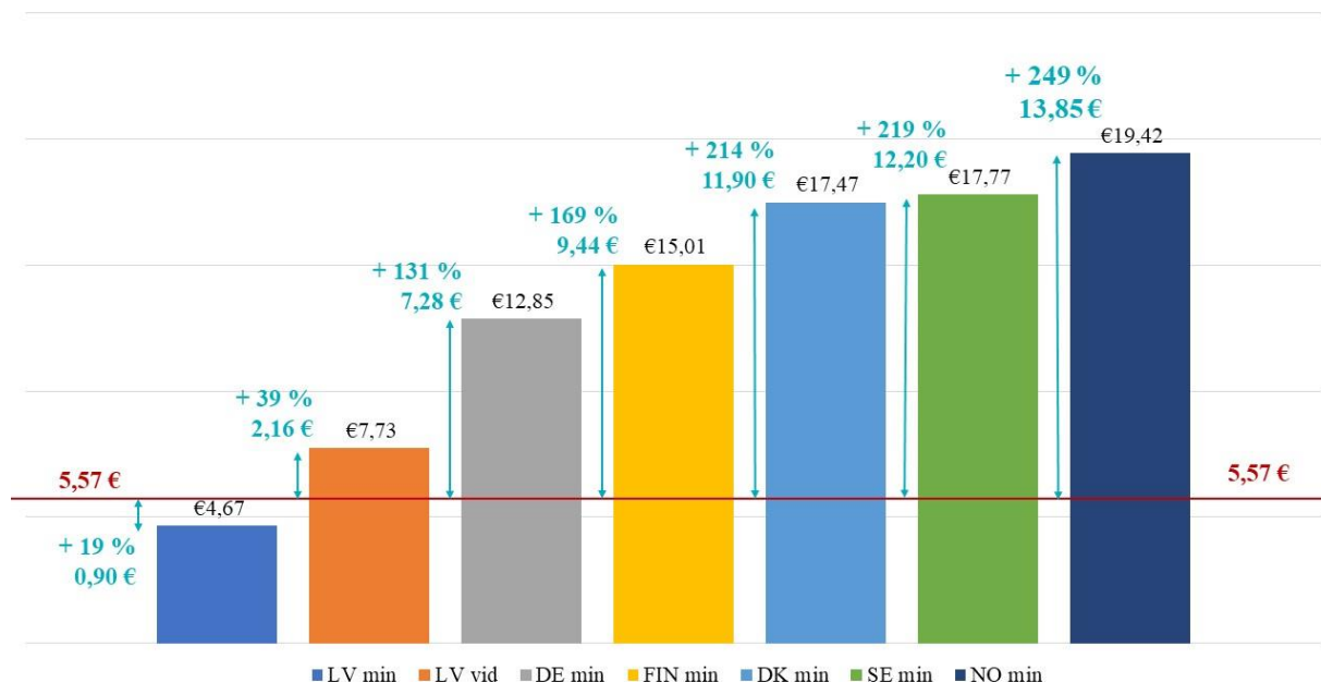
Minimālās likmes būvniecībā 2021.gadā